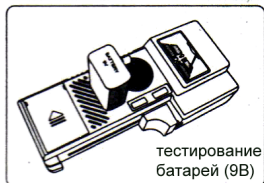
тестирование батарей (9В)