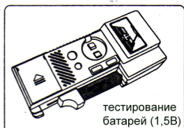
тестирование батарей (1,5В)