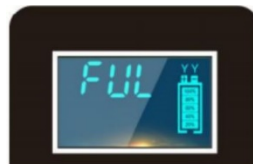
АКБ заряжена полностью