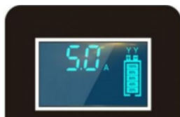
Сила тока зарядки